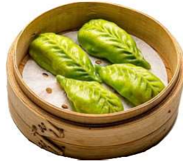
8 RAVIOLI SPINACI 3 PZ