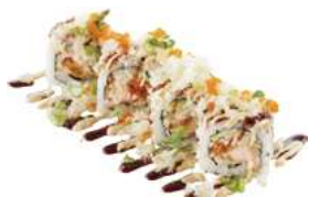
79 SAKE TAMPPAYAKI salmone fritto,avocado,tobiko, sesamofarina di tempura,salsa teriyaki