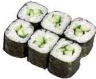
52 KAPPA cetriolo