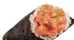
107 SPICY TEMAKI 🌶️