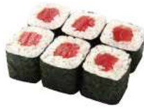
49 TEKKA tonno