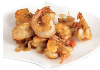
203 GAMBERETTI CON SALE E PEPE