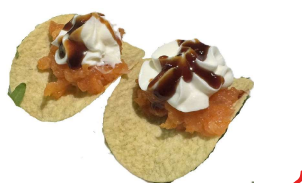
128 CHIPS PHILADELPHIA 2 PZ salmone, philadelphia,tobiko, chips, salsa teriyaki