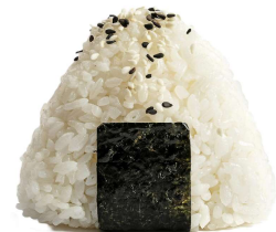
63 ONIGIRI KANI 1PZ polpa di granchio salsa teriyaki,sesamo