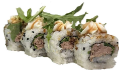
64 TONNO RUCOLA tonno cotto,rucola,sesamo philadelphia,teriyaki