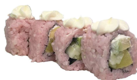
95 PINKI VEGE 4PZ philadelphia,avocado cetriolo,rapa barbabetola fresco con riso