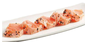
16 SAKE TATAKI 4 PZ salmone scottato salsa Japan