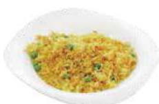
146 RISO CURRY piselli, uova, pollo