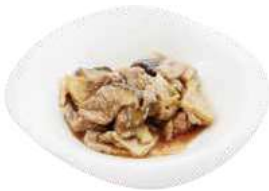
192 MANZO CON FUNGHI E BAMBÙ