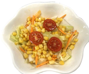
21 MIX SALADA insalata mista con salsa dello chef