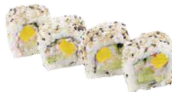
78 VEGETARIANO avocado, cetrioli, rapa gialla,sesamo