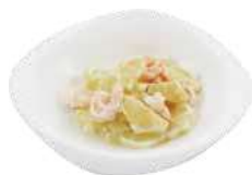
202 GAMBERETTI IN SALSA LIMONE