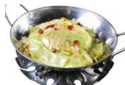
215 CAVOLI CINESE ALLA SCODELLA DI FUOCO