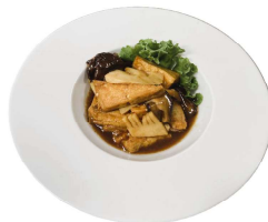
218 TOUFU CON BAMBÙ E FUNGHI