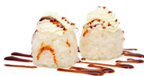
133 SHIROI teriyaki e philadelphia ,tobiko