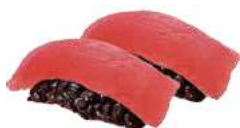
37 BLACK MAGURO tonno, riso nero