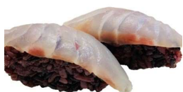
38 BLACK SUZUKI riso nero, spigola