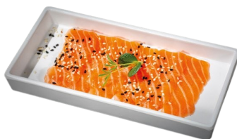
122 CARPACCIO SAKE 5 PZ salmone e salsa ponzu sesamo