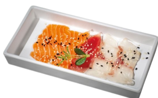
123 CARPACCIO 5 PZ pesce misto,salsa ponzu,sesamo