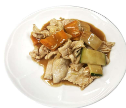
181 POLLO CON MISTO DI VERDURE