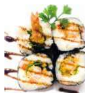
97 FUTU EBITEN 4PZ gambero fritto,philadelphia,tobiko, cetriolo,salsa teriyaki