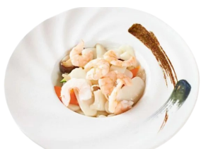
149 GNOCCHI DI RISO misto verdure, gamberi