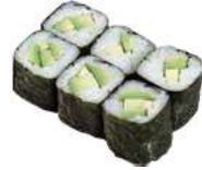
51 AVOCADO avocado