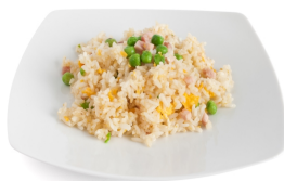
145 RISO CANTONESE uova, piselli, prosciutto