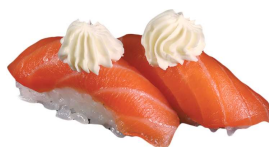
43 DINZU SAKE salmone, philadelphia