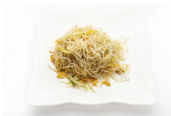
153 SPAGHETTI DI RISO GAMBERI gamberi, verdure, uova