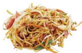
161 SPAGHETTI CON PESCE verdure, uova, misto pesce