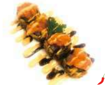
59 SPICY HOSO 4 PZ salmone fritto e salmone crudo piccante salsa teriyaki e spicy