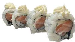
66 SAKE PHILA salmone,philadelphia, sesamo