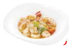
201 GAMBERETTI IN SALSA PICCANTE misto verdure, funghi