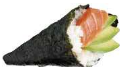
105 SAKE TEMAKI salmone, avocado,