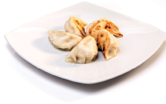
4 RAVIOLI DI CARNE ALLA GRIGLIA 4 PZ