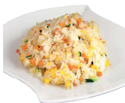
142 RISO VERDURE uova, misto verdure