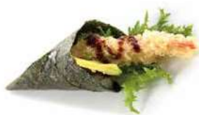
108 EBITEN TEMAKI gamberi fritti, avocado, salsa teriyaki