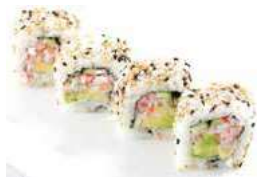
83 CALIFORNIA avocado,surimi, cetriolo,sesamo