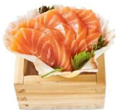
113 SASHIMI SAKE 4 PZ