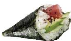
106 MAGURO TEMAKI tonno, avocado,