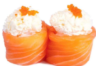
132 FLOWER LOVE philadelphia, salmone,tobiko