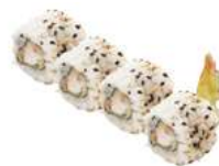
85 EBITEN ebi tempura,salsa teriyaki,maionese,sesamo