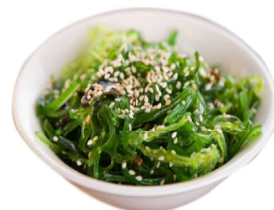
19 GOMA WAKAME alghe giapponese