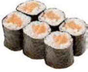
48 SAKE salmone