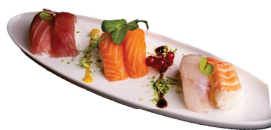
100 NIGIRI MIX 6 PZ