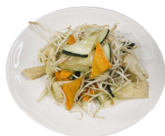
214 VERDURE MISTE