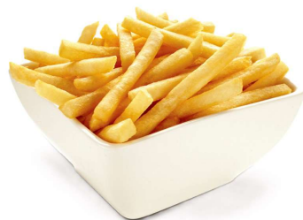
15 PATATINE FRITTE