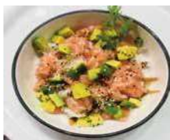
103 CHIRASHI SAKE riso, salmone, sesamo, avocado, salsa teriyaki, salsa goma