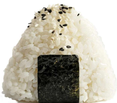
61 ONIGIRI 1PZ salmone cotto e salsa teriyaki,sesamo