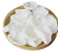
11 NUVOLETTE DI GAMBERI