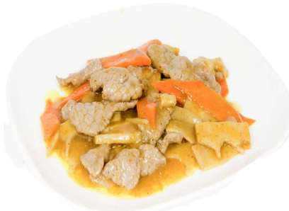
194 MANZO AL CURRY cipolla,bambu