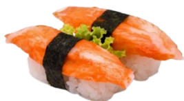
42 KANI surimi di granchio