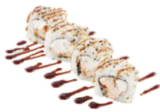
84 PHILADELPHIA salmone cotto,philadelphia salsa teriyaki,sesamo