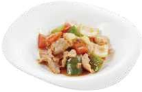
186 MAIALE CON SALSA PICCANTE peperoni,porro,cipolla,funghi,carote