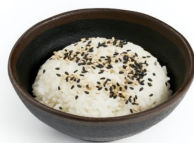
150 RISO BIANCO sesamo