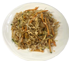
159 SPAGHETTI TAI verdure, uova