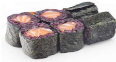
54 SAKE BLACK salmone con riso nero