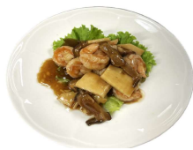
198 GAMBERETTI CON BAMBÙ E FUNGHI