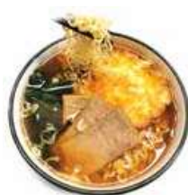
155 RAMEN manzo, alghe, cipolla, uova