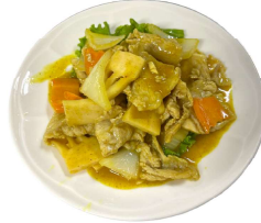
189 MAIALE AL CURRY cipolla,bambu