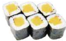
53 OSHINKO rapa gialla