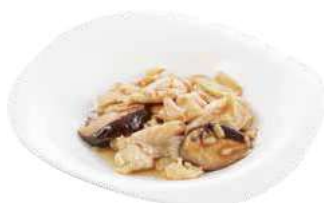
177 POLLO CON BAMBÙ E FUNGHI