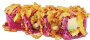
93 ONION ROLL salmone, cotto, avocado, cipolla philadelphia,salsa teriyaki,tobiko barbabetola fresco con riso