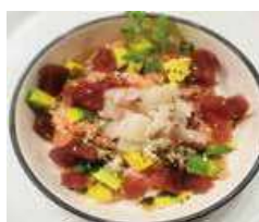
104 CHIRASHI MISTO riso, misto pesce crudo, avocado, salsa teriyaki, salsa goma, sesamo