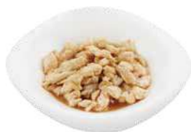
179 POLLO ALLA MANDORLE