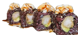
92 BLACK EBITEN gamberi fritti, avocado kataifi,salsa teriyaki, sesamo