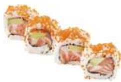
80 SAKE AVOCADO salmone avocado, tobiko