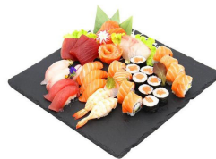
102 BARCA MIX 20 pezzi sushi misto