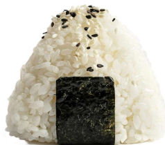
62 ONIGIRI EBITEN 1 PZ gamberi fritti e salsa teriyaki,sesamo