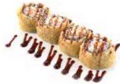
58 HOSOMAKI FRITTO 4 PZ salmone fritto e salsa teriyaki