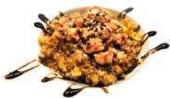
144 SAKE DON 4.00€ uova, salmone cotto, sesamo, salsa teriyaki