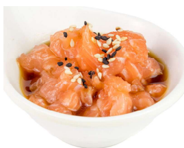
116 SAKE TARTAR salmone, sesamo, salsa ponzu