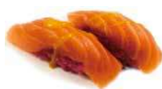
39 PINK SAKE riso rossa, salmone, salsa mango