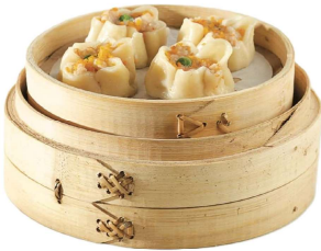
5 SHAOMAI 4PZ

farina, gamberi, carne, piselli, pesce bianco