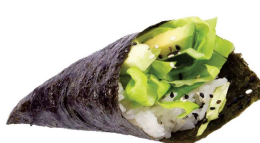
110 VEGE TEMAKI avocado e cetrioli