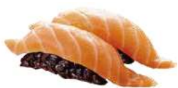
36 BLACK SAKE salmone, riso nero