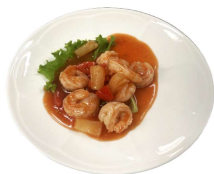
197 GAMBERETTI IN SALSA AGRODOLCE