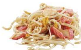
157 YAKI UDON uova, verdure, misto pesce