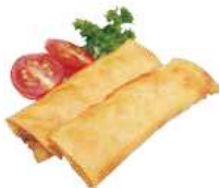
9 INVOLTINO VERDURE 2PZ