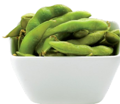
18 EDAMAME fagioli di soia