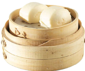
14 PANE AL VAPORE 2 PZ