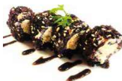
91 BLACK SAKE salmone cotto,philadelphia .salsa teriyaki,sesamo