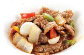
193 MANZO CON SALSA PICCANTE peperoni,funghi,carote,cipolla,porro