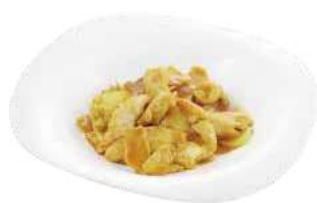
178 POLLO IN SALSA CURRY