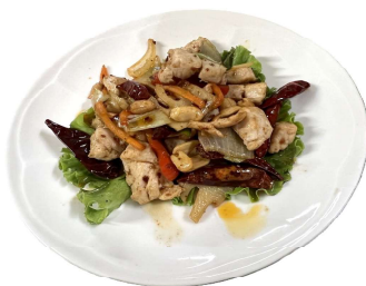
182 POLLO GONG BAO pollo con misto verdure