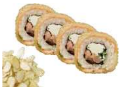
96 PHILADELPHIA FRITTO 4PZ salmone,philadelphia,salsa teriyaki, mandorle,sesamo