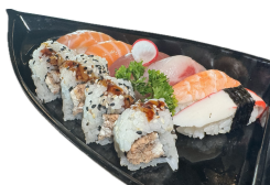
101 UME SUSHI 10 PZ 4 uamaki, 6 nigiri