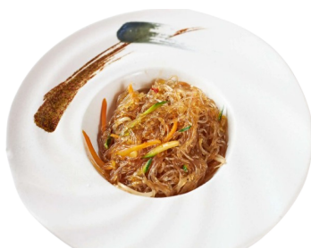
162 SPAGHETTI DI SOIA CON GAMBERI gamberi e misto verdure