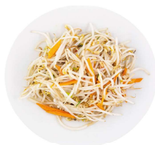
216 GERMOGLI DI SOIA