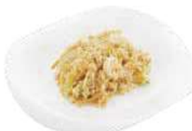
147 RISO SHANGHAI 🌶️ uova, verdure, gamberi